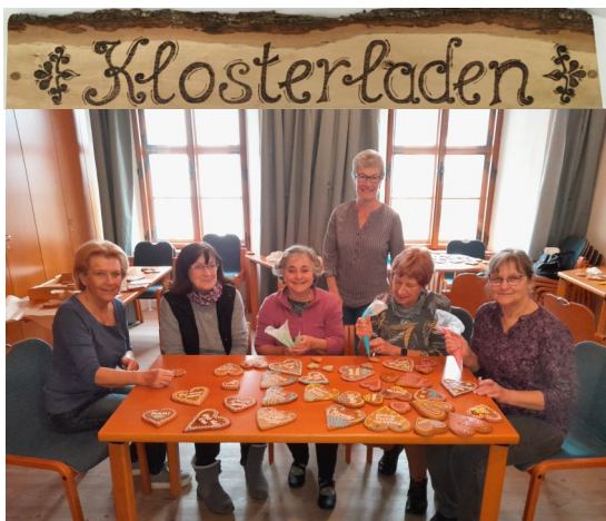
Die fleißigen Helfer beim Herzen verzieren!

Der Klosterladen ist jeweils am Sonntag nach der Hl. Messe geöffnet.